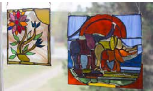
Blyinfattade små tavlor av Jeanette Flodin.