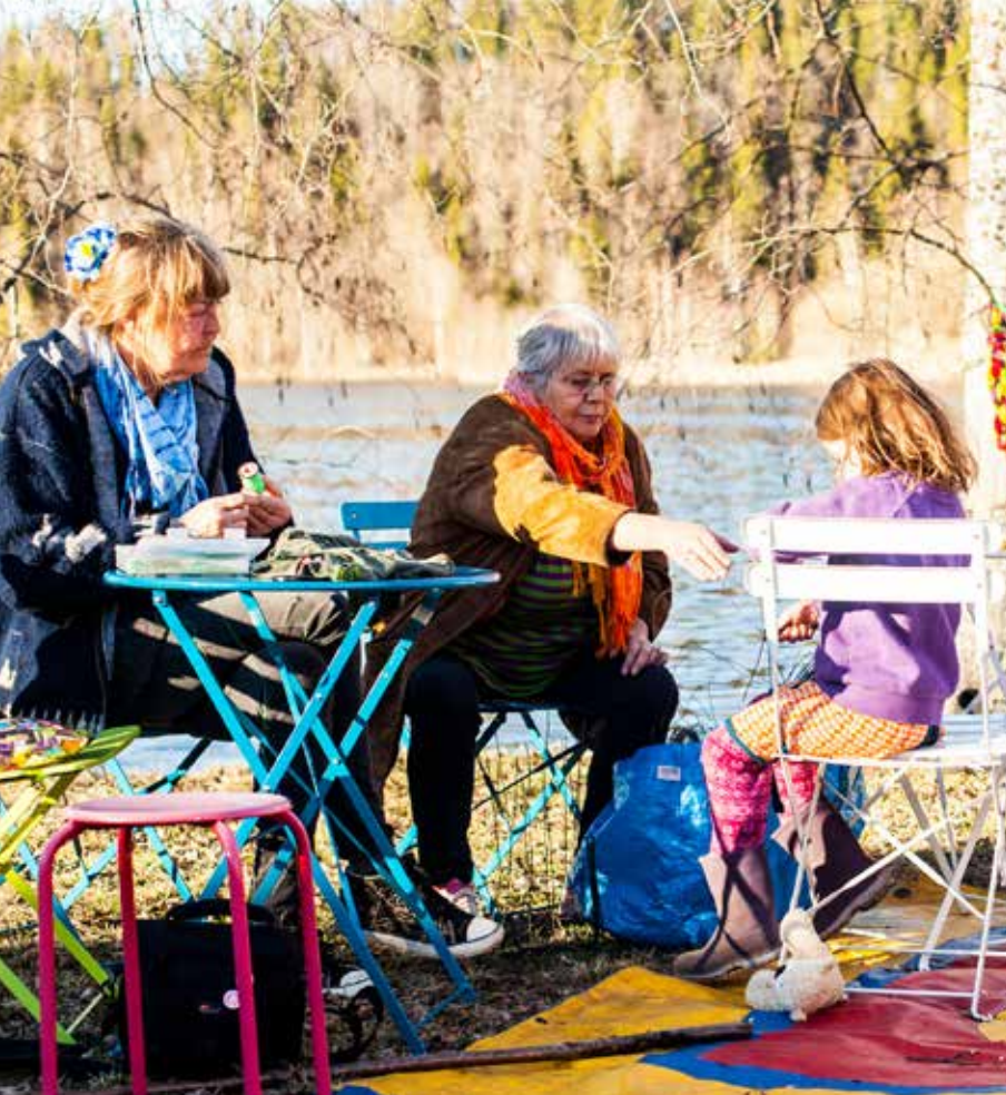
Ett glatt gäng har samlats för att slöjda och umgås i den härliga kvällssolen.