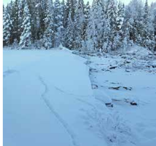
Fjällsjöälven vid Kilforsen.

Vi ser tre saker som viktiga att ändra på i villkoren. För det första ska kraftverksägaren Vattenfall alltid hålla en marginal till dämningssgränsen så att de inte behöver öppna luckorna så snabbt som skedde i vintras. Vetenskapen har visat att mjuka tappningsförändringar är bra, och det är också ett krav i den äldre vattenlagen som nuvarande dom för kraftverket vilar på. För det andra ska det varje år spillas extra mycket vatten under en vecka eller två, för att simulera en vårflod. Översvämningar vid vårflod är oerhört viktigt för att ekosystemet ska må bra, och bland annat har vi en rödlistad växt i Fjällsjöälven, Klådris, som behöver dessa årliga översvämningar. För det tredje ska tappningen öka både vinter- och sommartid. De regler som finns idag