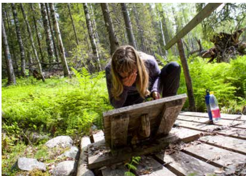
Från kallkällans iskalla vatten väcks både kropp och knopp till liv.

Ljusa och beckmörkt skulle det ju inte bli. Enligt kartan så skulle det finnas en stig den letade vi, och letade. Vi cyklade en bra bit stannade till vid en ingång som skulle kunna vara den vi letade, gick in på den och till en början var det en tydlig stig men den försvann mer och mer. Tillslut hade vi gått på tok och det var bäst att vända om. Det tog lång tid att komma tillbaka till fåboden, trötta och frusna gjorde vi upp eld i stugan och installerade oss i en varsin koja.