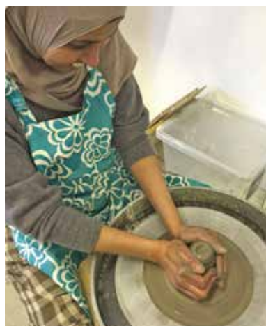
Här drejar en riktig naturbegåvning.

vision och hennes förslag var att vi skulle tänka stort eller litet, berätta mycket eller lite om Sverige, om Näsåker, om hemlandet eller om den långa resan hit, till-