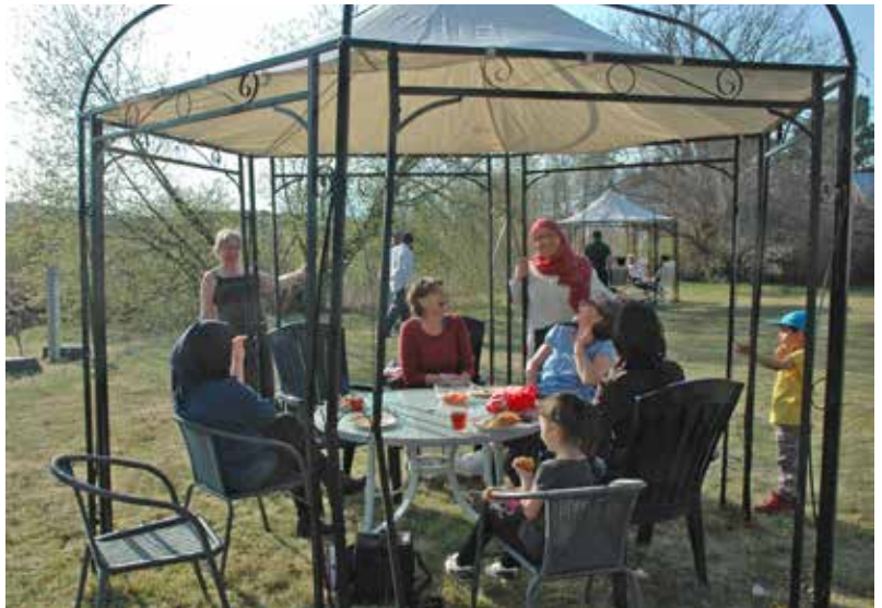
Mingel mellan ortsbor och nyanlända.