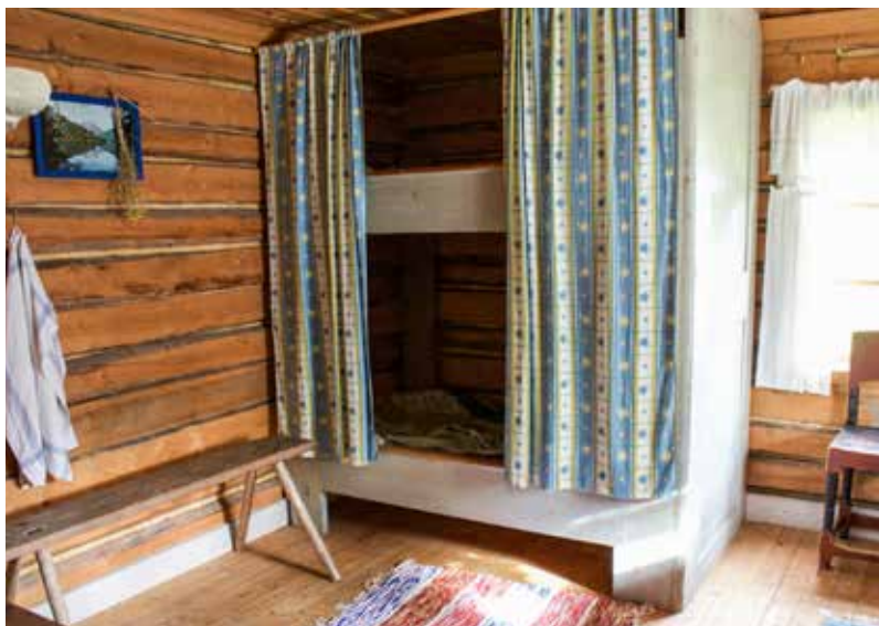
Är man kort nog sover man gott nog.