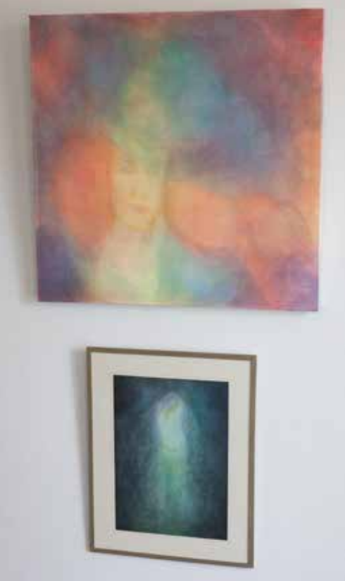
Anne Dahlö drömska tavlor.