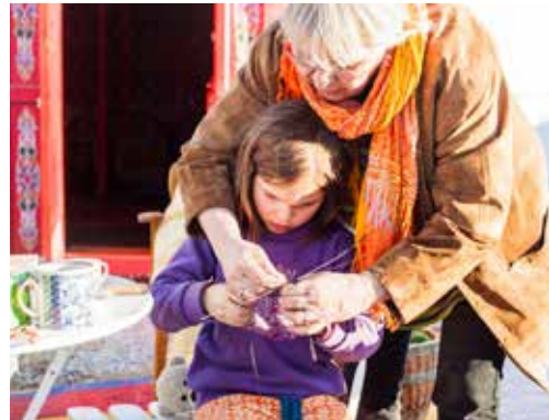
Från en hand till en annan, att slöjda lär man sig bäst i praktiken.